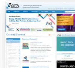
E-learning Guild http://www.elearningguild.com/