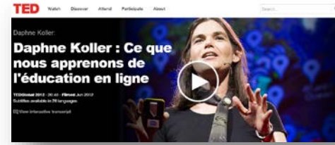
Conférence TED Daphne Koller

http://www.ted.com/talks/salman_khan_let_s_use_video_to_reinvent_education?language=fr