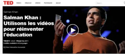
Conférence TED Salman Khan

http://www.ted.com/talks/salman_khan_let_s_use_video_to_reinvent_education?language=fr